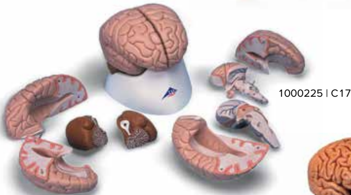
1000225 | C17