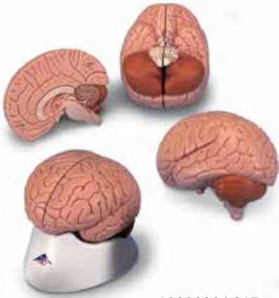
1000222 | C15